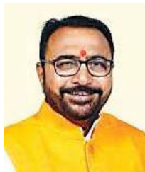
प्रतापराव जाधव (लेखक आर्यभट्ट मंत्रालय में केंद्रीय राज्य मंत्री (स्वतंत्र प्रभार) और स्वास्थ्य एवं परिवार कल्याण राज्य मंत्री हैं।)

एक सामूहिक संकल्प : सच्चा कल्याण अकेले अस्तित्व में नहीं हो सकता। मानव स्वास्थ्य, सामुदायिक कल्याण और संपूर्ण ग्रह का स्वास्थ्य आपस में गहराई से जुड़े हुए हैं। जलवायु परिवर्तन, जीवनशैली से जुड़ी बीमारियों और पर्यावरण के क्षरण की चुनौतियों के लिए न केवल नीतिगत हस्तक्षेप, बल्कि व्यवहार में परिवर्तन भी ज़रूरी है। इस अंतरराष्ट्रीय योग दिवस पर, आइए हम अपनी प्रतिबद्धता को योग मैट से आगे बढ़ाएँ और आइए हम योग को केवल दैनिक अभ्यास के रूप में ही नहीं, बल्कि जीवन शैली को सचेत उपभोग, आंतरिक अनुशासन और पारिस्थितिक जिम्मेदारी को प्रोत्साहित करती है। आइए हम प्रधानमंत्री के सचेत जीवन जीने के आह्वान पर काम करें और एक ऐसे भविष्य का निर्माण करें, जहाँ तर्कको और विकास को केवल हमारे उपभोग से नहीं, बल्कि हमारी जिम्मेदारी से जगह के तरीके से मापा जाए।