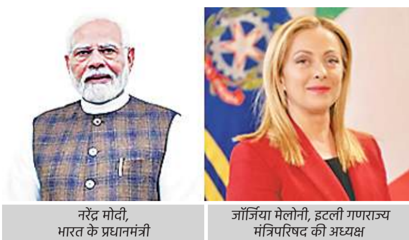
नरेंद्र मोदी, भारत के प्रधानमंत्री

तकनीकी नवाचार हमारी साझेदारी का सबसे महत्वपूर्ण आधार है। आने वाले दशकों में दुनिया एक बड़े तकनीकी बदलाव के दौर से गुजरेगी, जिसमें कृत्रिम बुद्धिमत्ता (एआई) क्वॉंटम कंप्यूटिंग, उन्नत विनिर्माण, महत्वपूर्ण खनिज और डिजिटल बुनियादी ढांचे जैसे क्षेत्रों में तेज प्रगति होगी। भारत का तेजी से बढ़ता नवाचार तंत्र और कुशल पेशेवरों की बड़ी संख्या, तथा इटली की उन्नत औद्योगिक क्षमता—इन दोनों में दोनों देशों के सहयोग को स्वाभाविक और रणनीतिक बनाती है। दोनों देशों के विश्वविद्यालयों और शोध संस्थानों के बीच बढ़ती साझेदारी भी इसे मजबूती देगी। भारत का डिजिटल पब्लिक इंफ्रास्ट्रक्चर (डीपीआई) पहले से ही दुनिया के कई देशों, खासकर ग्लोबल साउथ के देशों, के