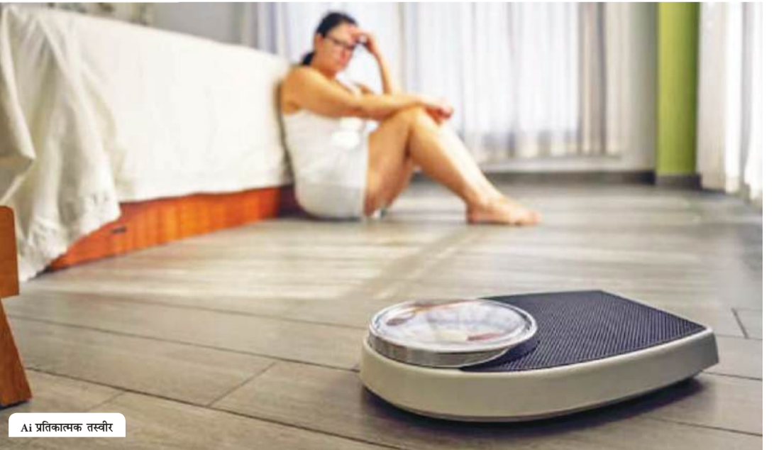
AI प्रतिकल्पक तस्वीर