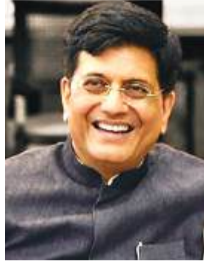
पियूष गोयल (लेबर केंद्रीय बाणिज्य और उद्योग मंत्री हैं)

हमारे प्रमुख निर्यात पर वर्तमान में 10% को लाभ पहुंचाता है।